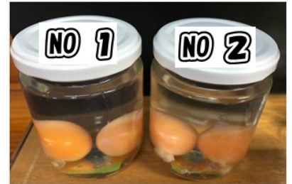
1/9 ① 乱流名水 ② 水道水