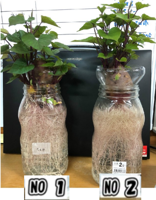
1/20 ① 根が太く白く 葉も色濃い ② 葉も生い繁り茎丈も長い 葉が小さく 色合いも薄い