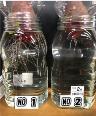
1/7 ① 根が伸長 ② 少し出た