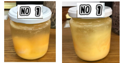
1/29 黄身形状有 2/3 水混濁 実験終了