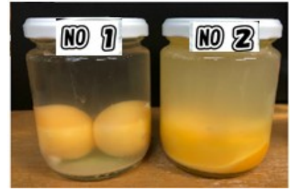
1/16 ① 少々濁りあるも変化なし ② 形が壊れ 腐敗臭 実験終了