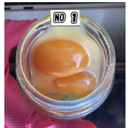
2/3 開封・黄身＝形状を保持してる 弾力性は弱い、腐敗臭はナシ

製造・卸売 有限会社 第一技販サービス 〒862-0921 熊本市東区新外1丁目5番43号 TEL 096-367-2008 ・ FAX 096-367-2108 Eメール gihan@movie.ocn.ne.jp